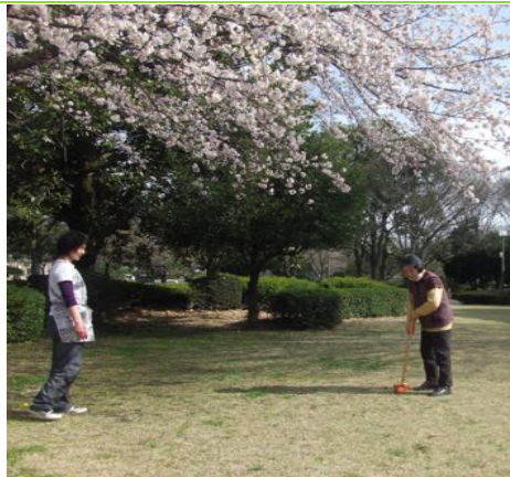
前橋運動公園でグランドゴルフ