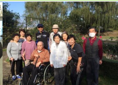
玉村北部公園散策