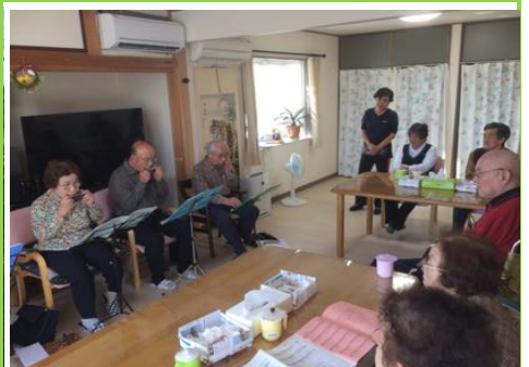
ハモニカ演奏会を清聴