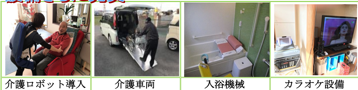
介護ロボット導入